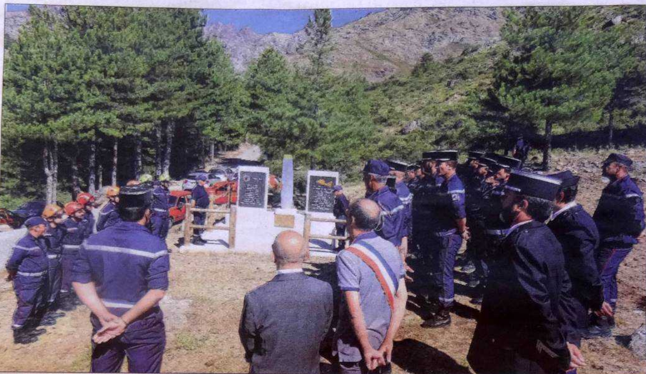
Mardi, une cérémonie rendait hommage aux trois victimes du crash du Pélican 22, le 4 juillet 1970.